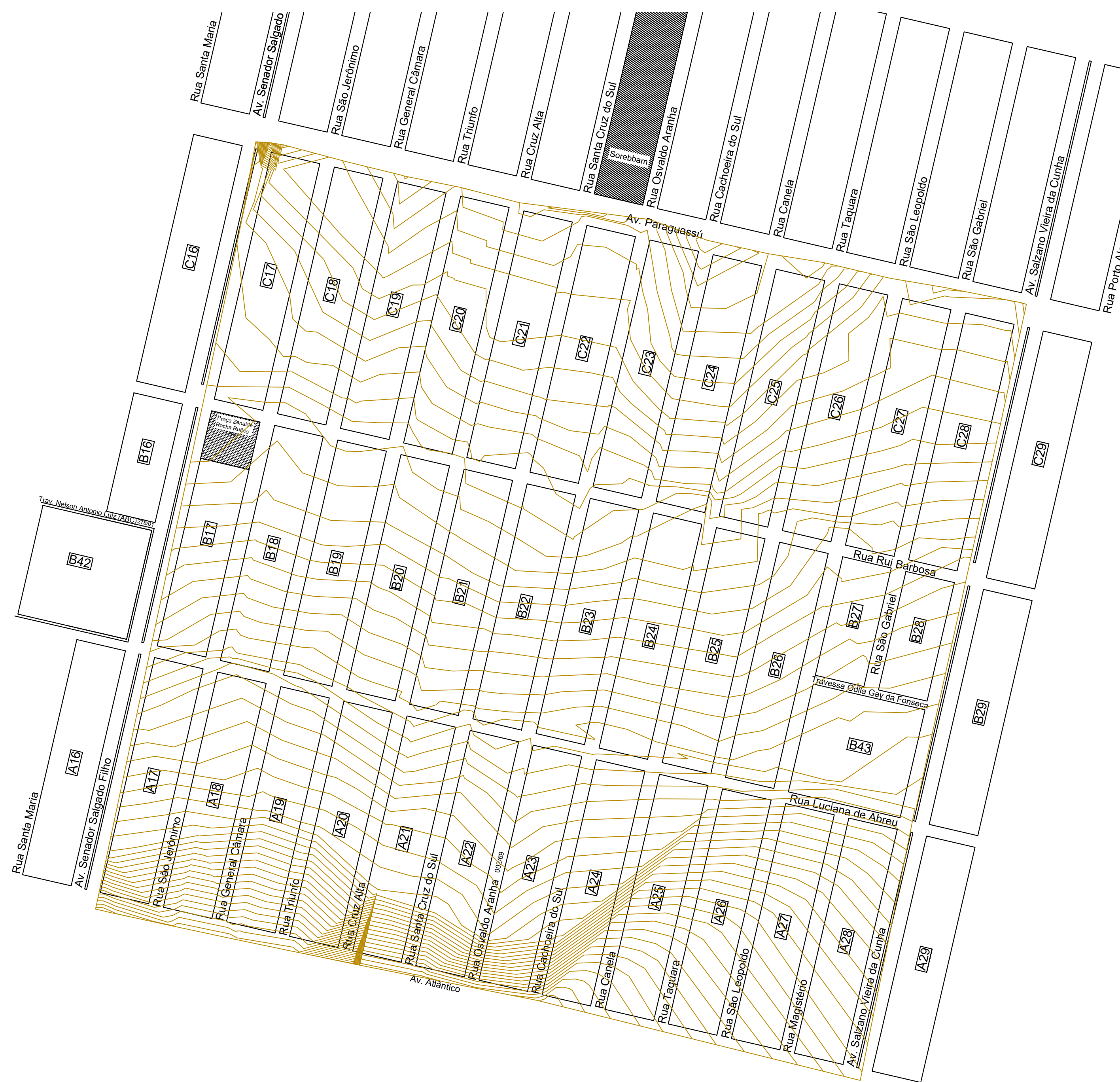
CURVAS DE NÍVEL 1/3000