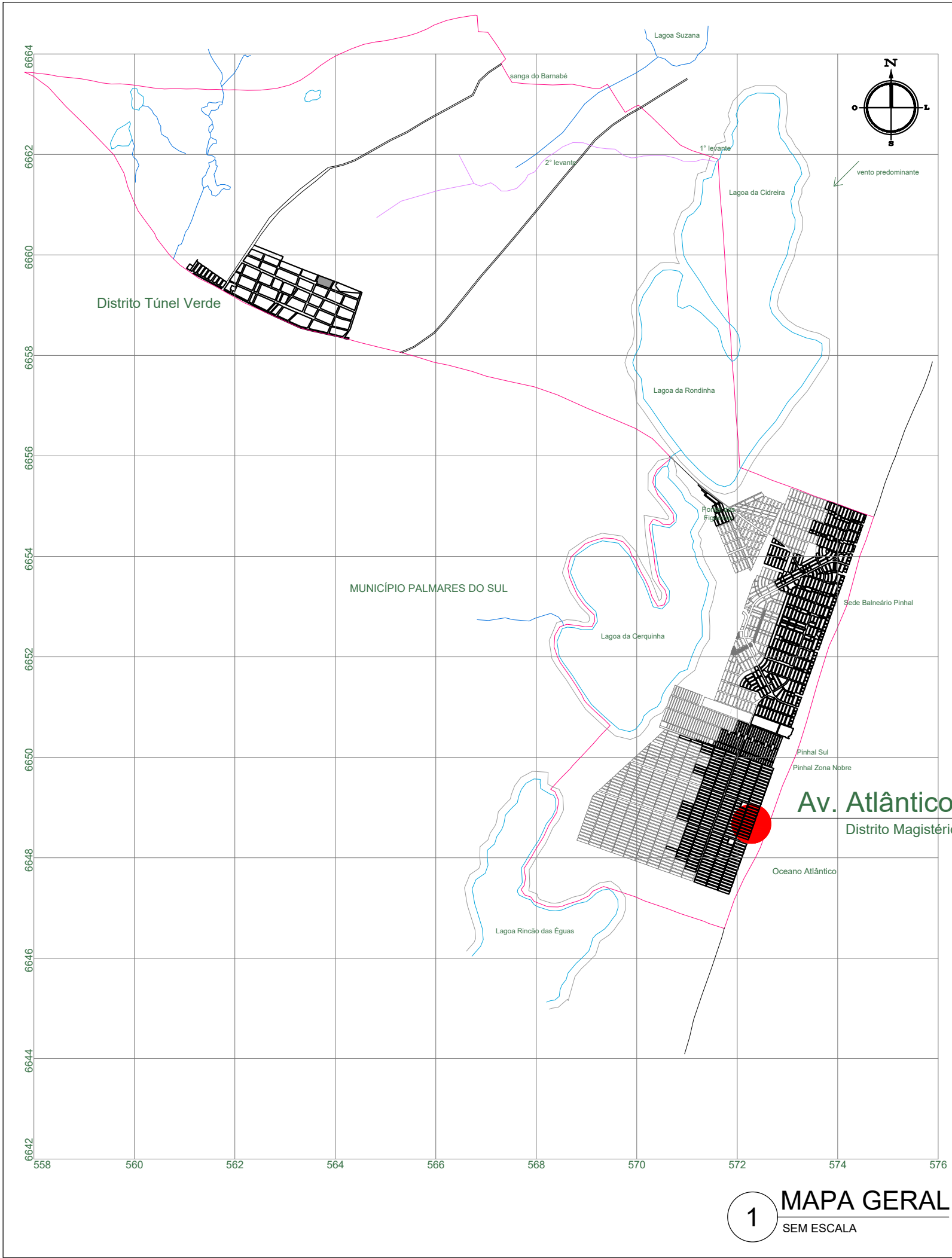
1 MAPA GERAL SEM ESCALA